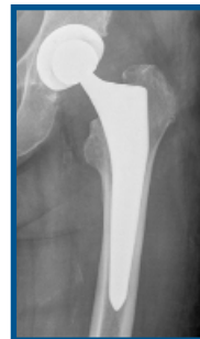
Röntgenaufnahme einer implantierten Hüft-Endoprothese