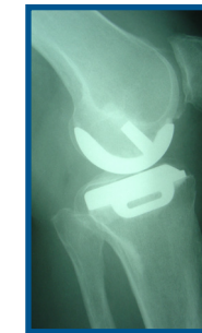
Röntgenaufnahme einer implantierten Knie-Schlittenprothese